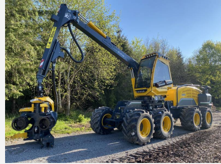
Abbildungen müssen nicht dem Original entsprechen