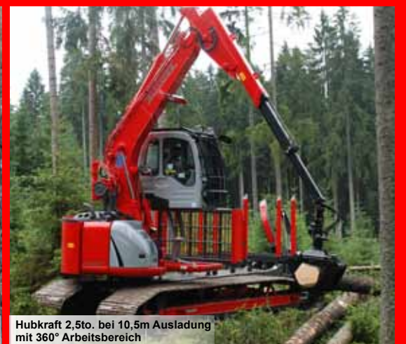
Hubkraft 2,5to. bei 10,5m Ausladung mit 360° Arbeitsbereich