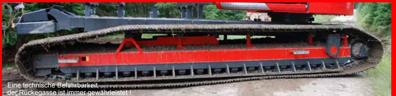
Eine technische Befahrbarkeit der Rückegasse ist immer gewährleistet!

EMB Baumaschinen Handelsgesellschaft mbH Gewerbepark 1 - D-94154 Neukirchen v.W. Tel: 0049 (0) 8504/9120-0 - Fax 0049 (0) 8504/9120-20 info@emb.eu - www.emb.eu