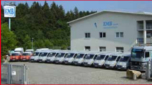
Ein stattlicher Fuhrpark vor der Werkshalle