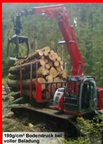
190g/cm 2 Bodendruck bei voller Beladung