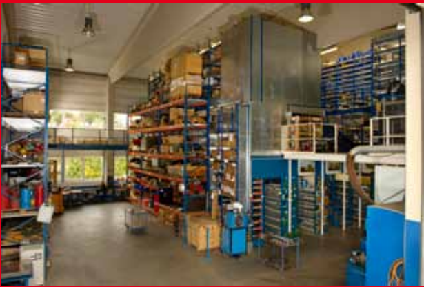
Das Lager, umfangreich und gut sortiert