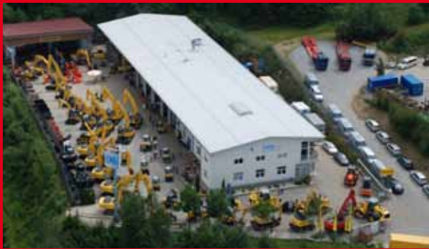
Der Firmensitz in Neukirchen v. W.