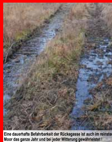
Eine dauerhafte Befahrbarkeit der Rückegasse ist auch im reinsten Moor das ganze Jahr und bei jeder Witterung gewährleistet!