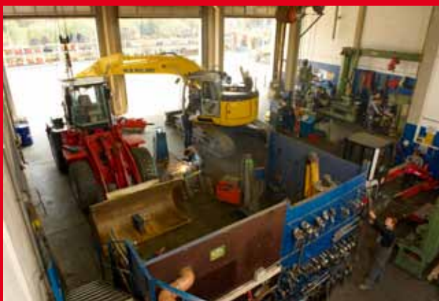
Einblick in einen Teilbereich der Werkstatt