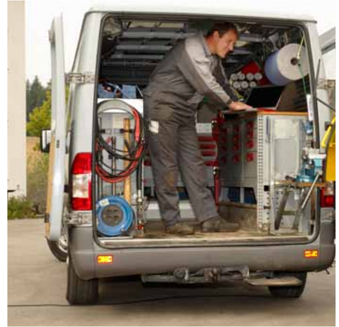
Bestens ausgerüstete Kundendienstfahrzeuge

Wir möchten auch für Sie alles leisten, wenn Sie das wollen!