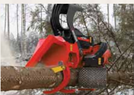
H 290 bis 90 cm