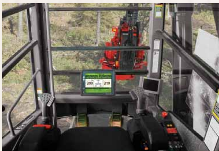
TimberRite macht aus Ihrem Harvester ein Hightech Büro direkt im Wald

Das TimberRite Messsystem wurde speziell für die 200-, 400- und 600-Waratah Serie entworfen. Es lässt Sie das Arbeitspensum durch das intelligente Kontrollsystem, zeitgleichem Informationszugang und kabellosem Daten Transfer managen.