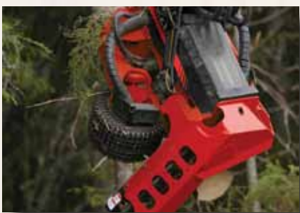
H 270 bis 70 cm