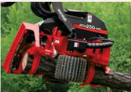
HTH 250 bis 50 cm