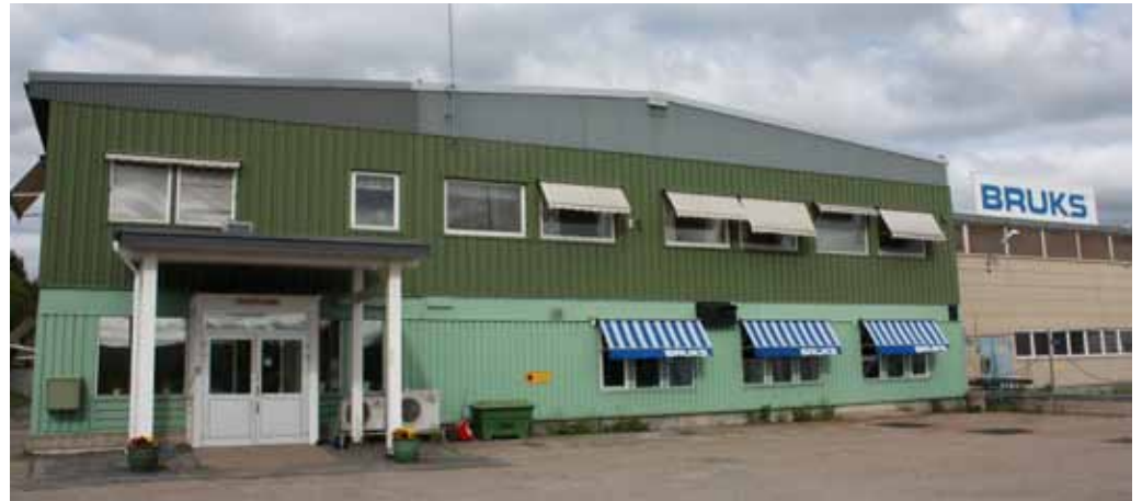
Bruks Mutterhaus und Produktionsstandort in Arbra: Hier werden alle mobilen und viele stationäre Komponenten hergestellt.

Bruks – ein wohlklingender Name seit über 75 Jahren im mobilen und stationärem Hackermarkt, inzwischen weltweit tätig – hat nun die mobile Hackermontage vom Produktionsstandort und Mutterhaus in Arbra, 15 km südlich nach Bollnäs, verlegt.