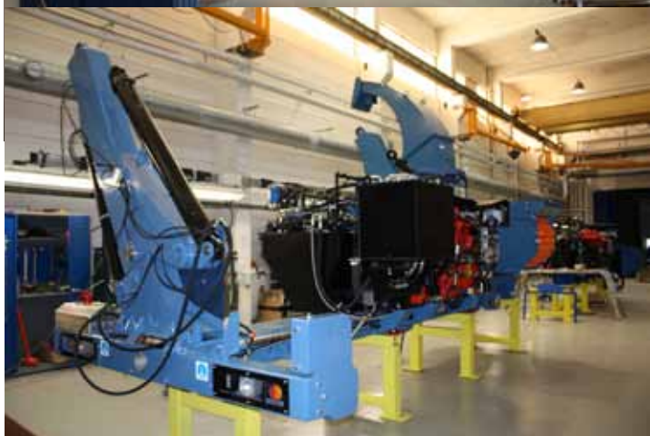
Serienfertigung Bruks 805.2