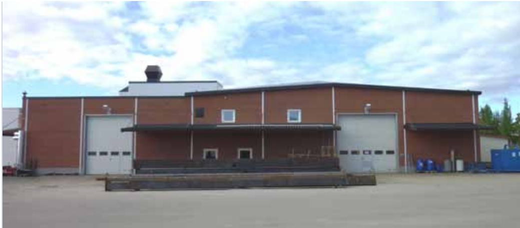
Bruks Montagestandort Bollnäs: Hier werden die Bruks Mobile Chippers 605, 805 und 1300 montiert und getestet.